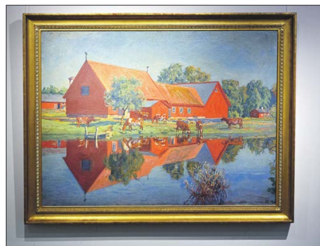
Et af de gamle malerier af Johannes Larsen, der er udlånt af museet i Kerteminde opkaldt efter ham.