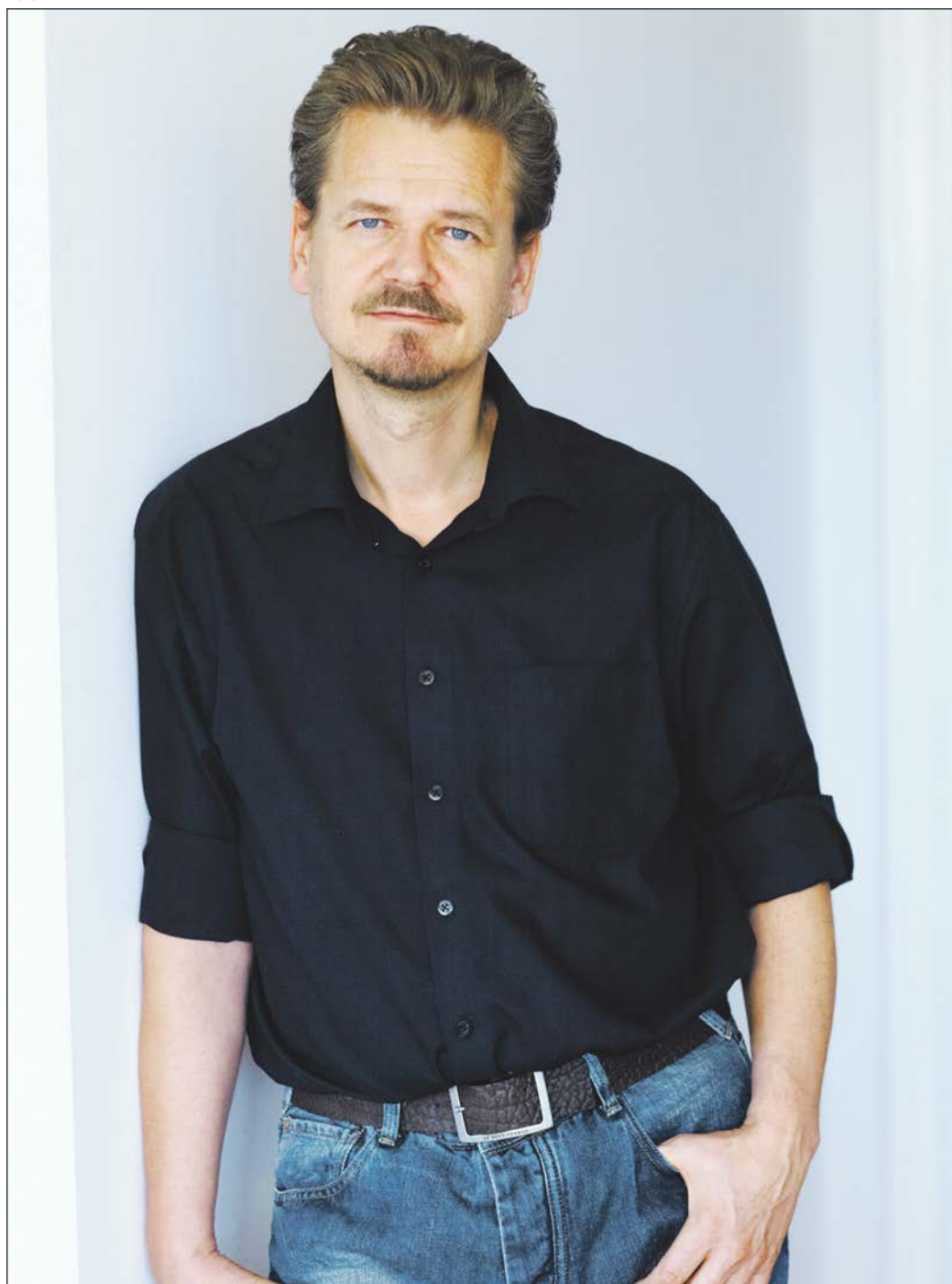
Kim Leine fik i januar »De gyldne Laurbær«, boghandlernes litterære pris, for murstensromanen »Profeterne i Evighedsfjorden«. Det er en 1700-tal-roman om grønlandske profeter. I sine romaner kredser Leine om mennesker, der er kastet ind i barske livsbaner, præget af misbrug og flugt. Det er rastløse typer splittet mellem det barske og nærværende liv i Grønland og det flade Danmark.

Som forfatter gør han første gang opmærksom på sig selv i 1990 med romanen »Hella«. På dansk foreligger hovedværkerne »101 Reykjavík«, »Islands forfatter« og »Stormland«, samt hans seneste bog »Lejemorderens guide til et smukt hjem« fra 2009, hvor en lejemorder skifter identitet til en prædikant. Hallgrímur Helgason modtog i 2002 Islands litteraturpris for »Islands forfatter«. (FIA)